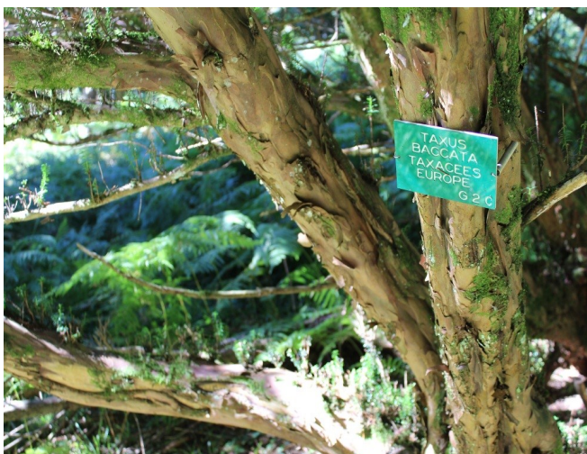
Une vue partielle de l'arboretum où subsiste environ 250 arbres sur les milliers qui ont été plantés.

De prestigieux organismes internationaux ont également collaboré à cette collection tel : Kew, Arnold Arboretum, Morton Arboretum, Jardin Botanique de Nanking, ainsi que des français comme Vilmorin, Les Barres, La Villa Thuret etc.... Il faudrait également citer les Services Forestiers et de nombreux Jardins Botaniques de tous les continents, pour avoir un aperçu de la mobilisation générée par ce projet.