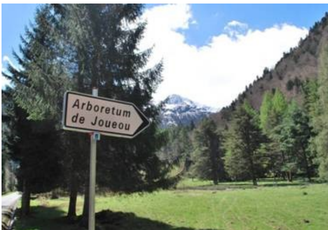
Sens de la visite du site

Parvenant du Monde entier, des milliers d'arbres furent plantés. Des graines recueillies par d'illustres explorateurs et botanistes, comme : Wilson, Forrest, Rock, Cheng, Martinez etc... ont été semées.